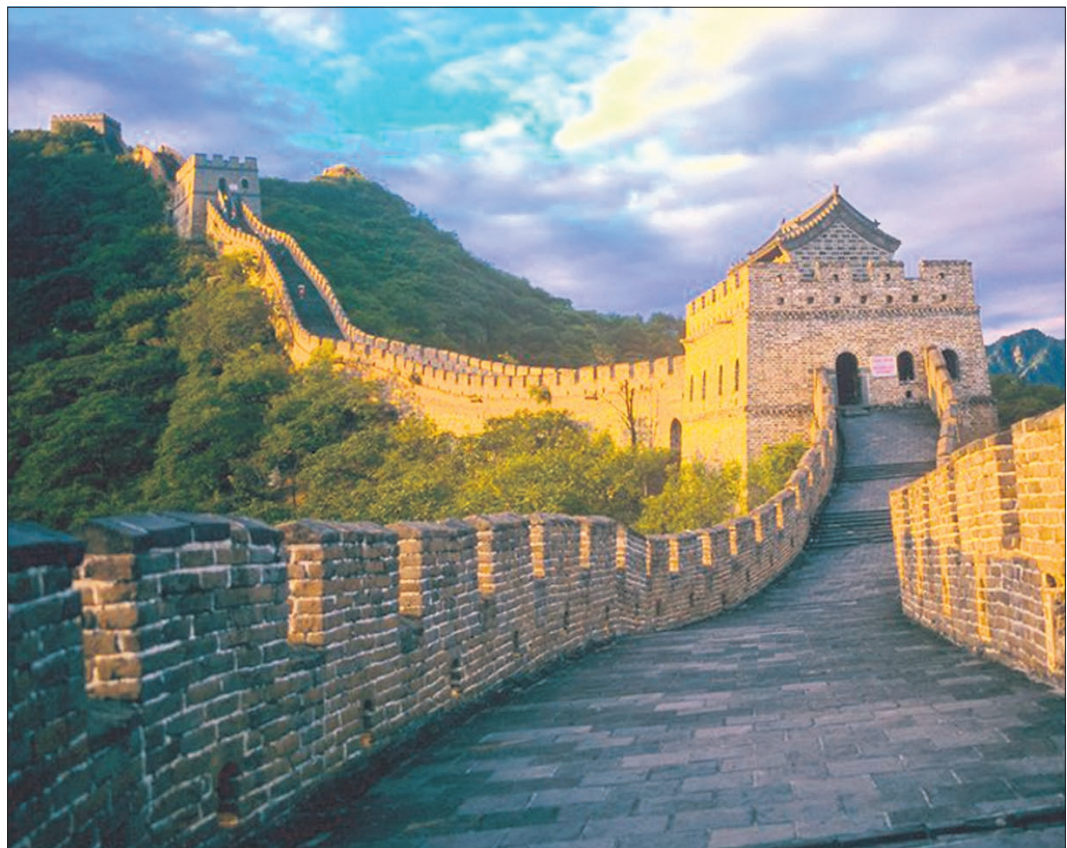
Die Traditionelle Chinesische Medizin beruht auf dem jahrtausendealten Studium der Natur.