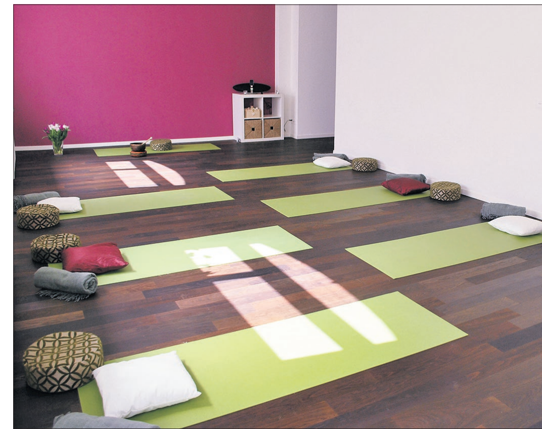
Yogaraum der Hatha Yoga Schule an der Zwinglistrasse 8 in Zürich. Eine Oase der Ruhe mitten im Zentrum der Stadt.